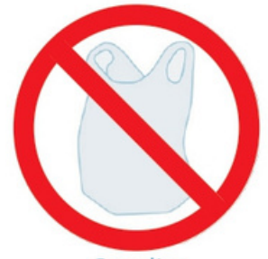
Sac dits «biodégradables»