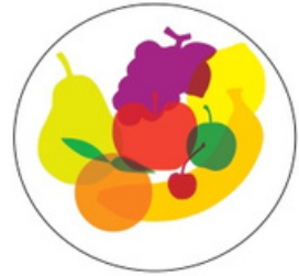
Déchets de fruits crus ou cuits