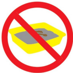
Litières d'animaux, même végétales