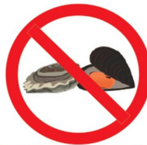
Coquilles dures : moules, huîtres, coquillages