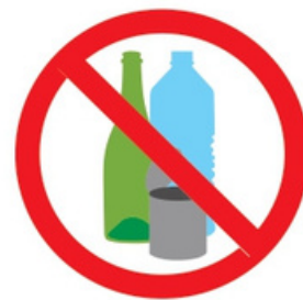
Sac plastique, verre, métal