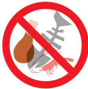
Restes de viande et de poisson