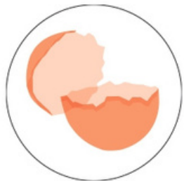
Coquilles d'oeufs écrasées