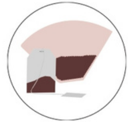
Café et thé avec filtres