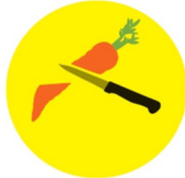
Pensez à découper