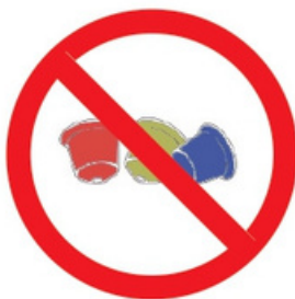
Dosettes de café ou de thé